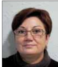
PORTAVEU PLATAFORMA AFECTATS DISCOTEQUES POLÍGON FAMADES

"Els empresaris creiem que podem aportar moltes coses a la nova Llei d'Espectacles. Reclamem que s'atorgui més protecció jurídica als propietaris de locals d'oci nocturn. S'hi poden fer moltes millores i nosaltres estem del tot disposats a col·laborar-hi perquè, tal com està ara, la llei no ens convenç".