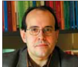
PRESIDENT JURISTES CONTRA EL SOROLL I MEMBRE ASSOCIACIÓ CATALANA CONTRA LA CONTAMINACIÓ ACÚSTICA

"És una lluita desproporcionada. Molts veïns han marxat, però no es tracta d'això. Nosaltres ja hi érem abans que s'obrissin aquestes discoteques i no pararem fins a aconseguir el nostre dret a poder descansar. No pretenem que clausurin aquests locals, però sí que els desplacin allà on no puguin molestar a ningú".