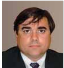
PRESIDENT FEDERACIÓ CATALANA D'OCI NOCTURN (FECALON)